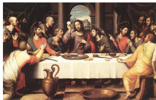
Juan de Juanes: La Última Cena